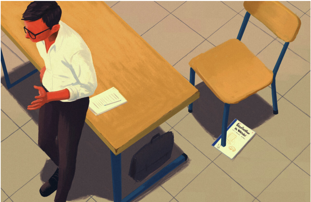
Illustration von Johan Keslassy.

Die Schulleitung und die meisten Lehrerinnen und Lehrer mögen mich. Meine Autorität ist ein Asset für den ganzen Trakt. Wenn ich die Treppe hochkomme, wird es gleich ein wenig leiser und gesitteter. Bei der Klasse, die ich unterrichte, nehmen Regelverstösse ab, und auch das Verhalten der Schüler untereinander wird ein wenig zivilisierter. Warum das so ist, darüber sind sich die erfahrenen Lehrer einig: «Du nimmst sie ernst, du bereitest dich vor, du hast eine klare Linie und du hast einen Plan für sie. Genau darauf kommt es an.»