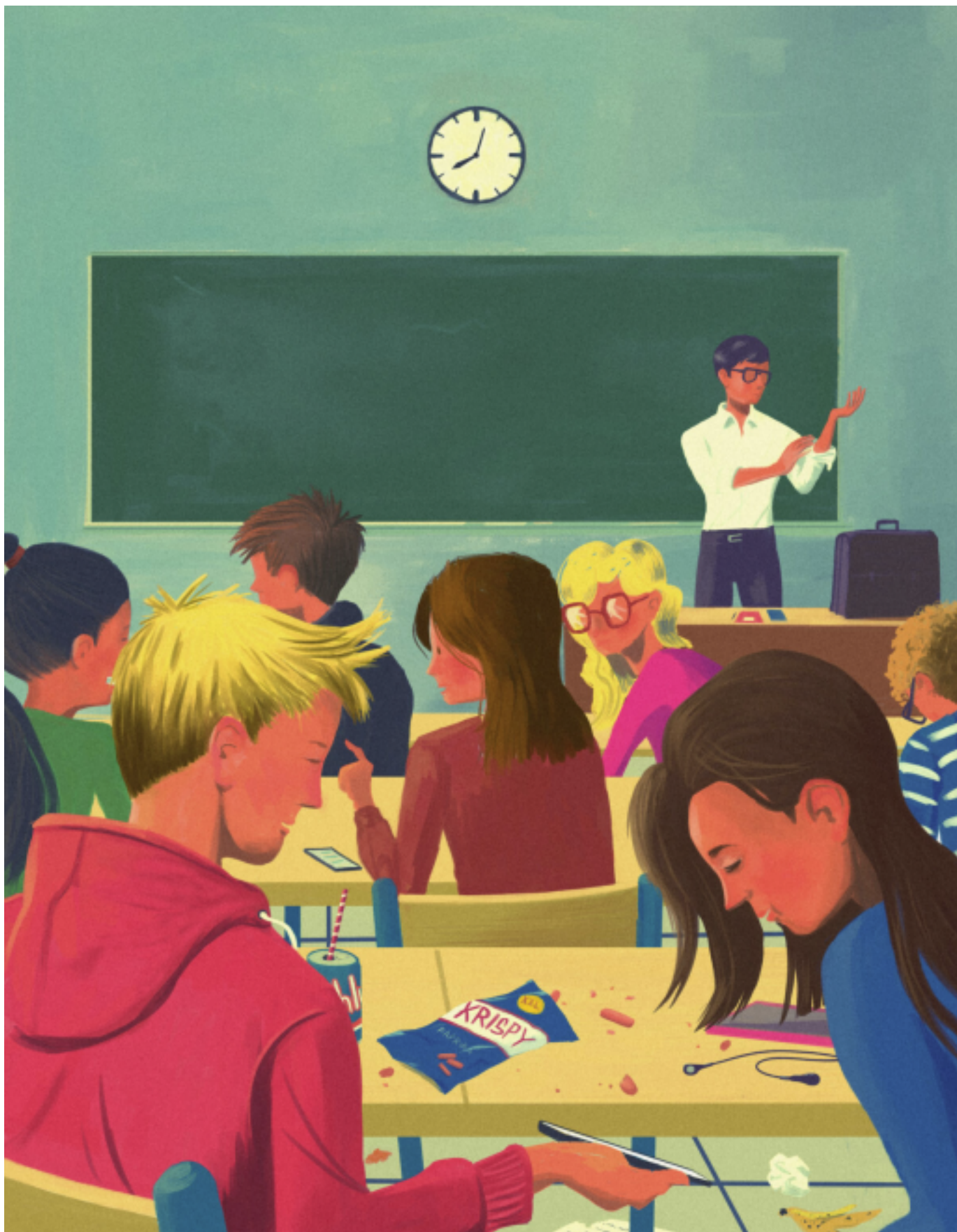
Illustrationen von Johan Keslassy.