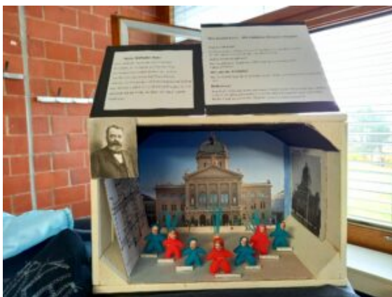
Der Bau des Bundeshauses