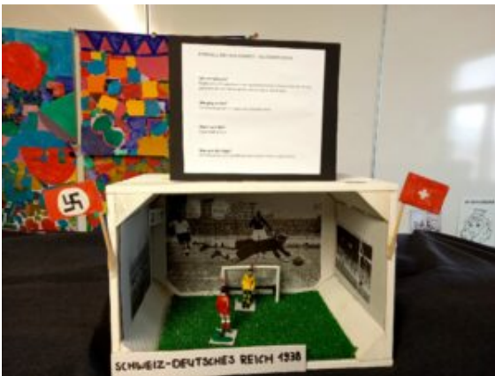
Der Sieg der Schweizer Fussballmannschaft gegen das Team des Grossdeutschen Reichs.