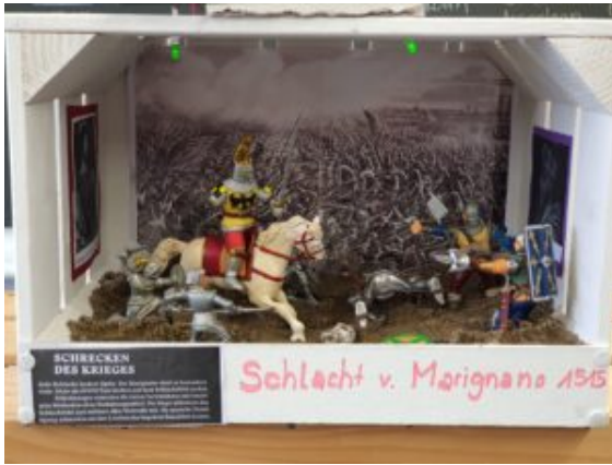
Die Schlacht von Marignano