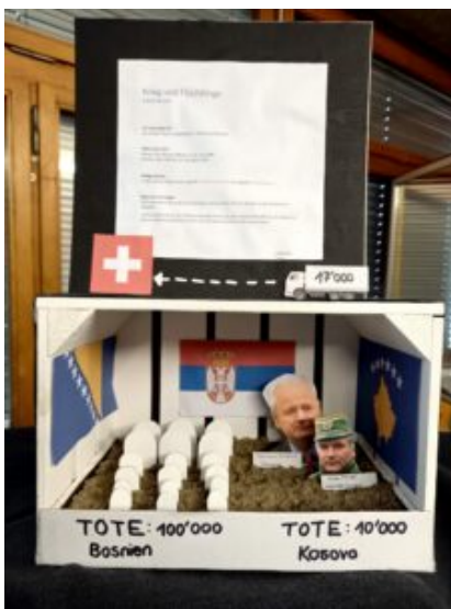
Das Massaker von Srebrenica