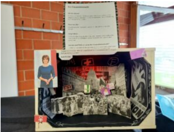
Einführung des Frauenstimmrechts