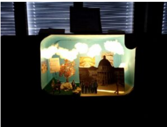
Die Gründung der ETH